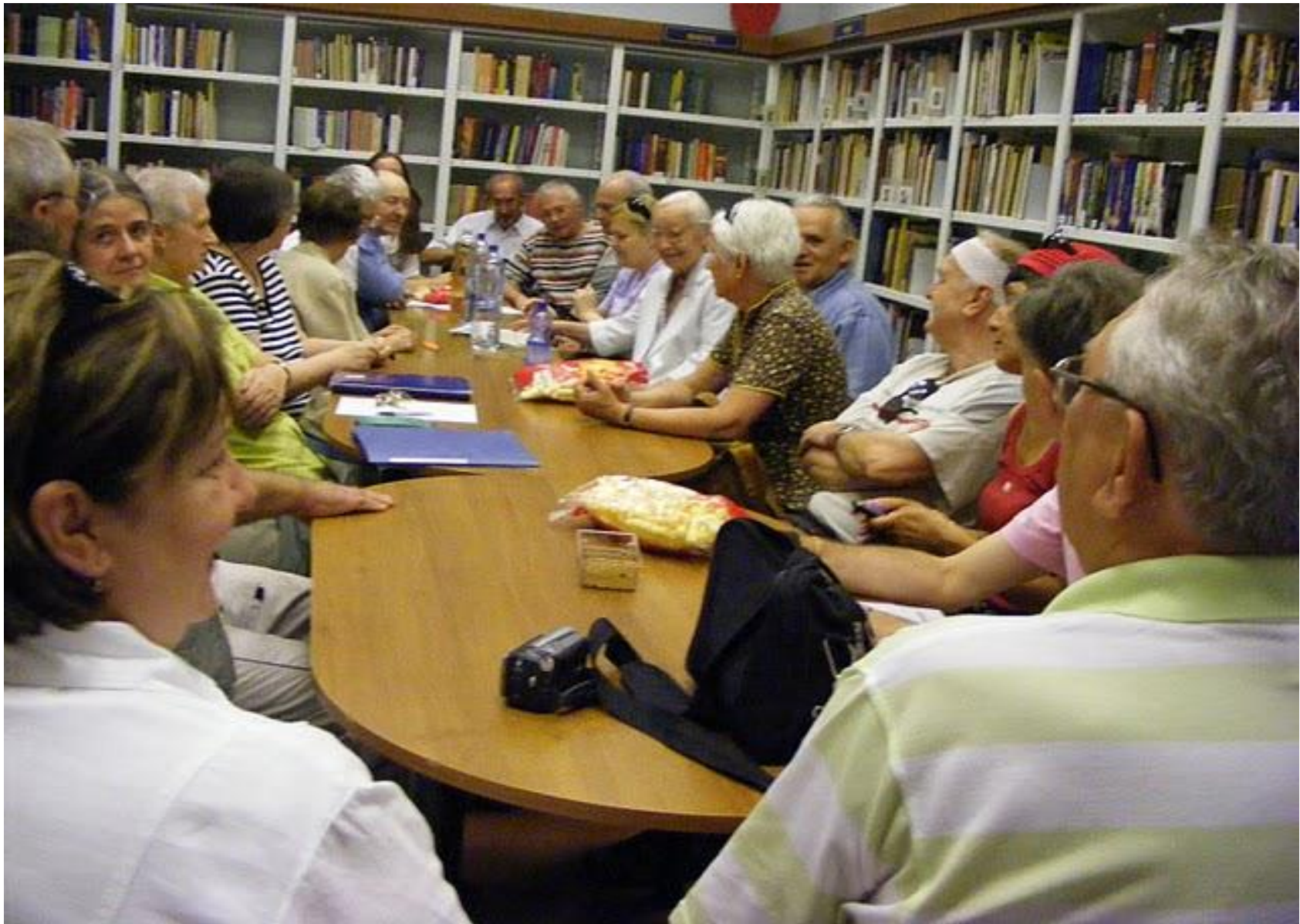
AFÁZIA-AZ ÚJRABESZÉLŐK EGYESÜLETE